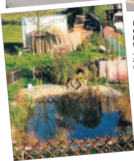
Ist modern und hat viel Platz: das Weixdorfer Jugendzentrum (F. o.). Ein Stückchen Idylle: Auch das „Drumherum“ soll schön aussehen, deshalb wurde ein kleiner Teich (F. I.) angelegt.