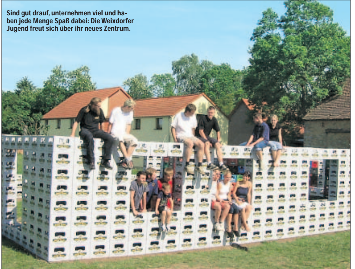
Sind gut drauf, unternehmen viel und haben jede Menge Spaß dabei: Die Weixdorfer Jugend freut sich über ihr neues Zentrum.